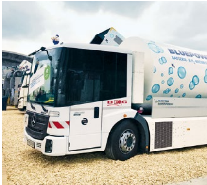
Faun sammelt 2019 erste Praxiserfahrungen.

Vor dem Hintergrund von Fahrverboten für Dieselfahrzeuge müssen sich die Betreiber kommunaler Fuhrparks mit alternativen Antrieben befassen. Faun hat mit „Bluepower“ ein attraktives Angebot im Programm: Die Faun-Aufbauten Rotopress und Viajet lassen sich mit einem vollelektrischen Fahrgestell – einem Mercedes-Benz Eonic – kombinieren. Der Faun Bluepower ist batterieelektrisch unterwegs und verlängert mithilfe einer Wasserstoff-Brennstoffzelle seine Reichweite auf bis zu 650 Kilometer. Die Hochvolt-Batterie (Lithium/Eisen/Phosphat) für den elektrischen Antrieb reicht beim Rotopress-Aufbau für zwei Touren mit je zehn Tonnen Abfall an einem Tag. Für das Plus an Reichweite sorgt der Range Extender mit bis zu drei Brennstoffzellen-Modulen. Die Brennstoffzellen-Leistung beträgt 30, 60 oder 90 kW. Die Wasserstofftanks zur Versorgung der Brennstoffzellen können flexibel ausgewählt werden für 400 kWh, 700 kWh und 1000 kWh. Die Reichweite bis zu 650 km erzielt der Faun mit dem größten Tank.