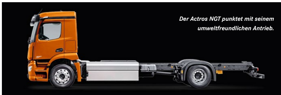
Der Actros NGT punktet mit seinem umweltfreundlichen Antrieb.

Innovative Funktionalitäten werden vom neuen, intuitiv bedienbaren Multimedia-Cockpit aus gesteuert. Zwei zehn Zoll große Farb-Displays ersetzen das klassische Kombiinstrument. Hinter dem Lenkrad liegt das Primärfahr-Display, rechts davon vereint ein Touchscreen die Funktionen des herkömmlichen Schalterfeldes. Also gilt auch für das Innenleben des Actros: schwer zukunftsorientiert.