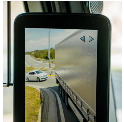
Oben: Die MirrorCam ist das Erkennungszeichen des neuen Actros. Unten links: Abstandslinien helfen beim Blick auf den rückwärtigen Verkehr. Unten rechts: Beim Abbiegen schwenkt die Kamera mit.