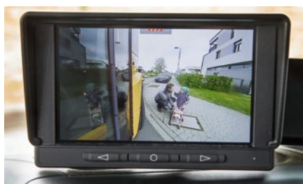
Das Totwinkel-Kamerasystem (TKS) rechnet den Bewegungsentwurf des Fahrzeugs mit ein.

Überall dort, wo der Fahrer nicht hinsieht, hilft das Totwinkel-Kamerasystem (TKS) des Econic. Zu dem optionalen System gehören vier Kameras – nach jeder Seite eine. Die intelligent gesteuerten Kameras reagieren auf den Lenkwinkelsensor und den Blinker und zeigen dem Fahrer immer den Ausschnitt an, den er mit seinem Bewegungsentwurf ansteuert. Im Stand und bei eingelegerter Bremse blendet das System dem Fahrer Bilder aller zur Verfügung stehenden Kameras ein. Bei Vorwärtsfahrt bis 10 km/h sieht der Fahrer die Ansicht „Frontspiegel“, über 10 km/h wird das seitliche Sichtfeld für die Seite, in die geblinkt oder gelenkt wird, dargestellt. Über 35 km/h schaltet sich das Display aus, um den Fahrer nicht