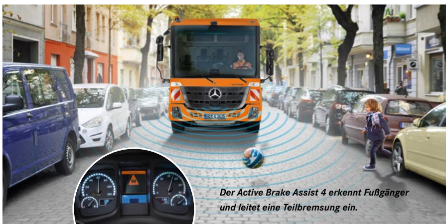
Der Active Brake Assist 4 erkennt Fußgänger und leitet eine Teilbremsung ein.

vom Verkehrsgeschehen abzulenken. Beim Rückwärtsfahren werden das Sichtfeld der Heckkamera und zusätzlich die beiden seitlichen Sichtfelder gezeigt. Mit dem Zusatzlenkstock kann der Fahrer in den manuellen Modus schalten und das gewünschte Sichtfeld selbst anwählen.