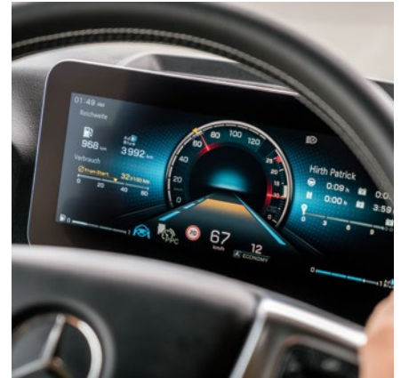
Oben: Zusätzlich zu dem Display hinter dem Lenkrad besitzt der Actros einen Touchscreen, der das bisherige Schalterfeld ablöst.